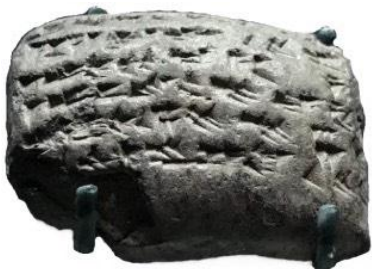
Testimonios de presencia filistea en Babilonia, tras la destrucción de la pentápolis filistea.

Ocho décadas antes de que Cambises conquistase Egipto y se convirtiera en Faraón de la XXVII Dinastía, Nabucodonosor II arrasa la Pentápolis filistea en el 604 a. e. c. y sus gentes fueron transferidas a babilonia asentándose en al-Hazatu, próxima a Nippur, ciudad en la cual pertenecían los exiliados de Aza (Gaza), asimilándose con el tiempo, y poco después, siguiendo el mismo trayecto que anteriores invasores, destruye Judea (587), dando comienzo el primer gran exilio judío a Babilonia -a al Yahudiya -. Cinco décadas después el pueblo judío comenzaría a regresar a Judea por decreto de Ciro el Grande.